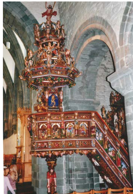
Prekestolen i Stavanger domkirke fra 1696 er Smiths storverk.

Smith laget også prekestoler for kirkene i Egersund og Sokndal og altertavler for kirken i Sokndal, på Lye og Åkra og i den gamle Peterskirken (revet i 1815) i Stavanger. Smith laget også en rekke portretter og skar ut praktmøbler og senger.