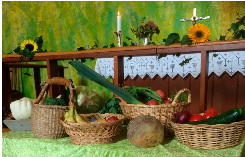
Flott pynta kirke da det var Høsttakkefest.