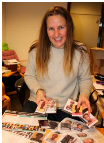
14 Elin har laget bønnekort med bilder av barna som får støtte gjennom Kanhaug.