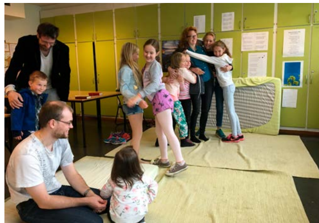
Moro på søndagsskolen.