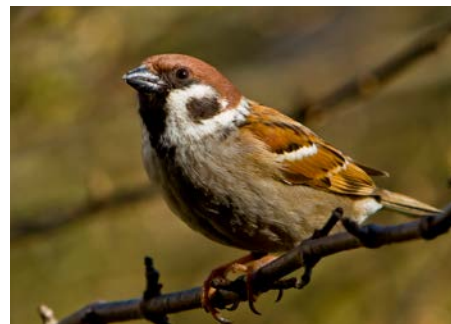
Pilfink , ligner gråspurv, men er brun på hodet og har svart flekk på «kinnet»