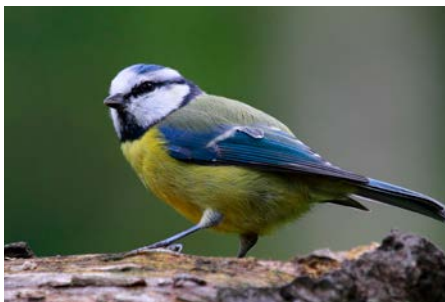
Blåmeis er litt mindre enn kjøttmeisen, og er blå på hodet.