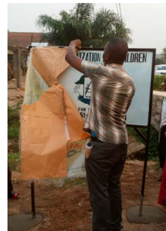
Kanhaug er på plass i Makeni! Lokalpolitiker avduker skiltet.