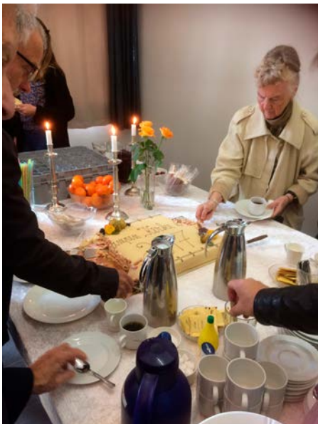
Vi feiret kirkas 60 års bursdag 1.oktober.