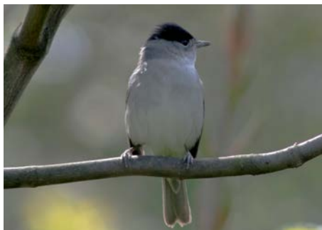
Munk , en sanger som av og til overvintrer. Hunnen har brun brette, hannen svart.