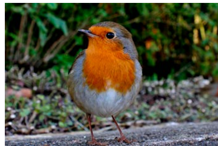
Rødstrupe : Ikke vanskelig å skjønne hvor den har navnet fra.