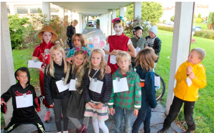
Kampenspeiderne klare for Globalløpet. De løp inn 1650 kroner til utviklingsprosjekt på Sri Lanka.