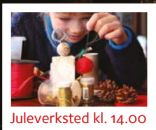
Juleverksted kl. 14.00

Information: telefon 92 22 43 43 www.svenskakyrkan.se/norge/stavanger Facebook: Svenska kyrkan i Stavanger