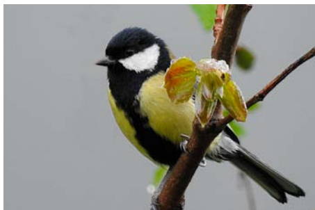
Kjøttmeis kjenner du på den gule fargen.

blitt observert på fuglebrett på Byhaugen, en riktig «julete» fugl som trives der det er skog i nærheten.